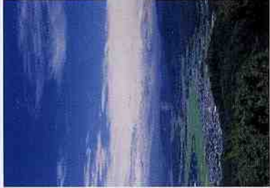
筑波高原キャンプ場からの風景