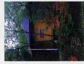
野外活動センター山びこの郷

真言宗智山派の寺で、建永元年（1206）辨海上人の開山といわれており、当時は笠間の正福寺とたえず勢力争いをしていたが、宇都宮時朝に攻められた時に寺は焼失した。大永 2 年（1522）空法上人によって再興され、隆盛時には 300 人の僧侶が常時修行していた。木造弘法大師像、両界曼荼羅版木、礼盤は県指定の文化財になっており、賀籠、大師堂は町指定の文化財になっています。