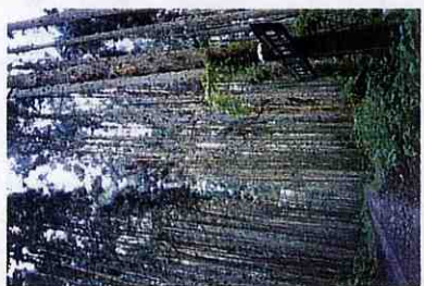
皇都川沿いの杉並木