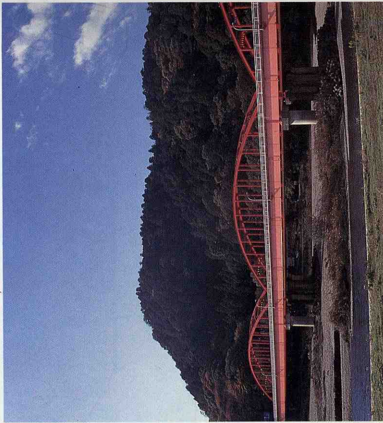
御前山と那珂川大橋