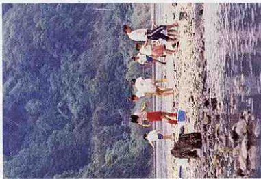
清流那珂川での水遊び