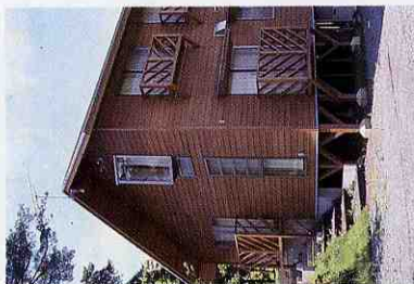
御前山青少年旅行村